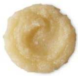
リハブソルティ (リキッドシャンプー) 600g / ¥5,900 (税込)

ラッシュの人気シャンプー『果草力』をベースに、シーソルトを加えることで、フレッシュな香りのミントが爽快感を与える、スクラブ感のあるリキッドシャンプーが誕生しました。