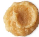
スウェル (リキッドシャンプー) 600g / ¥5,900 (税込)

髪を健やかに保つシーソルトと海藻のエキスでできたスクラブ感のあるリキッドシャンプー。潮風になびく無造作なヘアスタイルを叶えます。