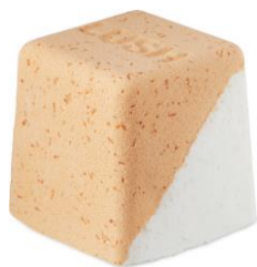
コールドウォーターソーザー ¥1,200(税込)

イギリス・チェルシーの朝を歌った曲からインスピレーションを得たバスボムは、「バタースコッチのように太陽の光が降り注ぐ」という歌詞からとろけるように甘い香りが誕生しました。レモンマートル、トンカ、パニラをブレンドしてバタースコッチのホッと甘い香りを再現しました。