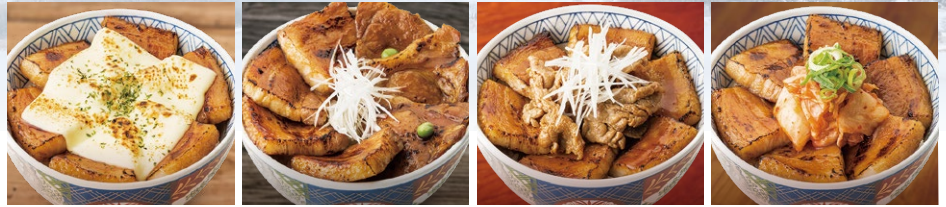
(左より) 炙りチーズ豚バラ丼<並>/ハーフ&ハーフ丼<並>/豚バラMIX丼<並>/キムチ豚バラ丼<並>

北海道 帯広名物の風味をそのままに、豪快に焼きあげ、豚の旨味を凝縮した究極の一杯。秘伝ダレが食欲をそそる、丁寧に焼かれたお肉は一口食べれば香ばしさがお口いっぱいひろがります。