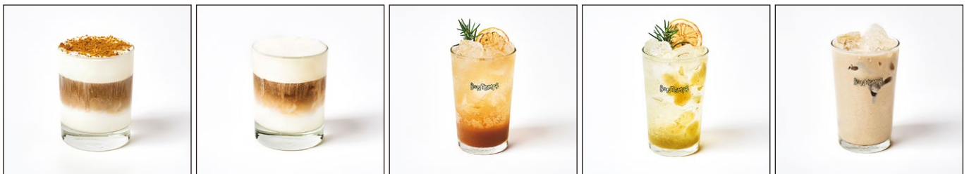
ボンタンクリームコーヒー