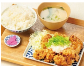
おろしポン酢 から揚げ定食