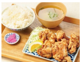
元祖から揚げ定食