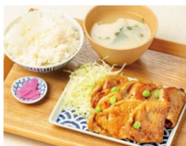
帯広豚ロース定食