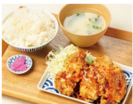
チリソース から揚げ定食