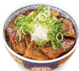
おろしポン酢豚丼