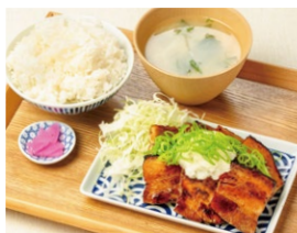
おろしポン酢 豚バラ定食