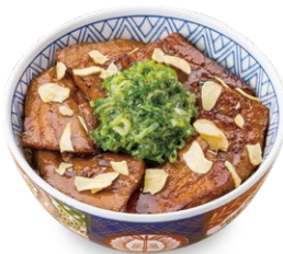
ねぎ塩ガーリック豚丼