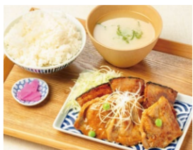
ハーフ&ハーフ定食