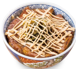
高菜明太マヨ豚丼