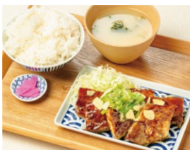
ねぎ塩ガーリック 豚バラ定食