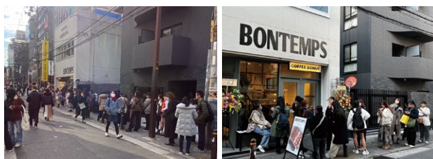
大阪「アメリカ村本店」のオープン時の様子。