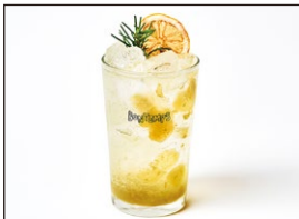
シャインマスカットアイド