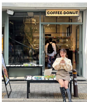
ドーナツは期間限定を含め20種以上ラインナップ。