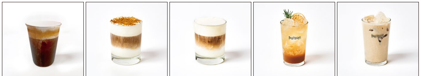
塩クリームアメリカーノ