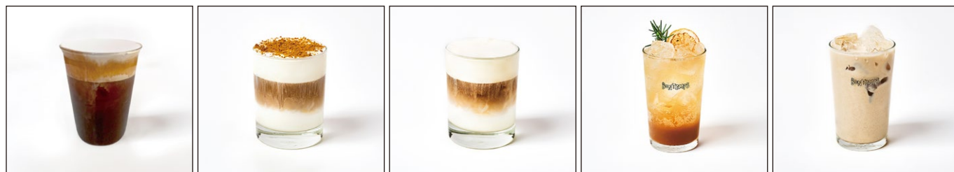
塩クリームアメリカノ