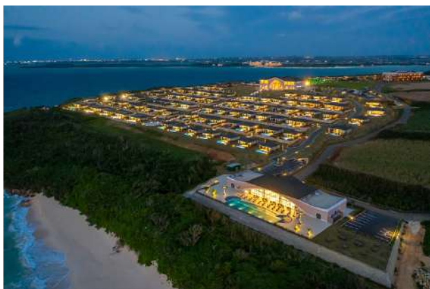
「宮古島来間リゾート シーウッドホテル」の様子