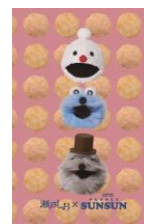
スンスンばかうけアソート