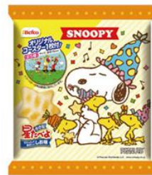
スヌーピー小さな星たべよ（しお味）