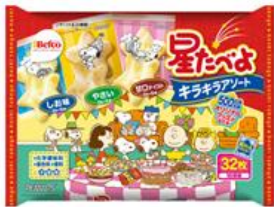
星たべよキラキラ3種アソート