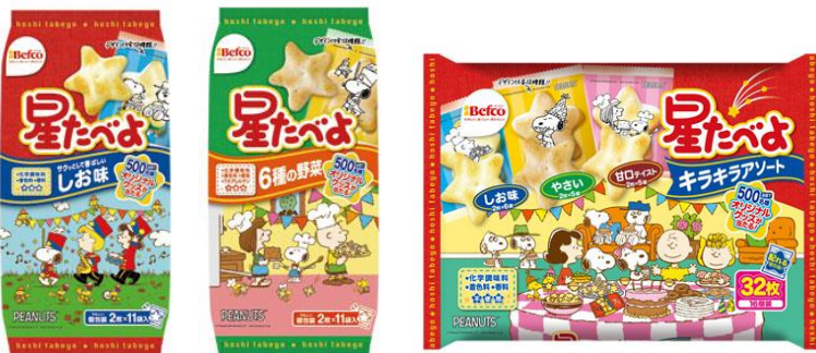
星たべよ（しお味） 星たべよ（やさい） 星たべよキラキラ3種アソート