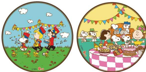
スヌーピー小さな星たべよ（しお味）