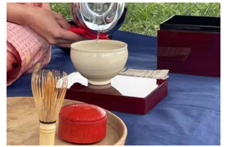
ピクニック茶会（野点）茶の湯サロン 耀庵