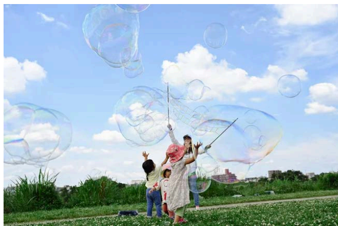
シャボン玉づくり体験