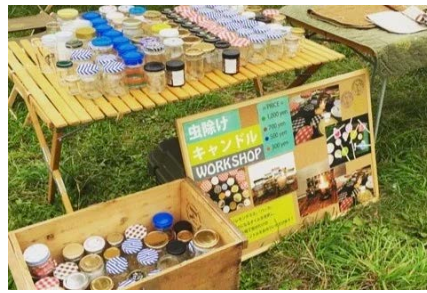
虫除けキャンドルワークショップ