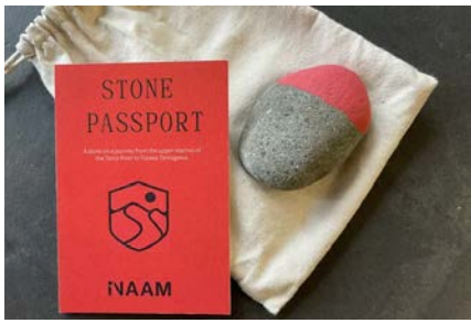
石が旅する。川と時間を感じるストーンアート