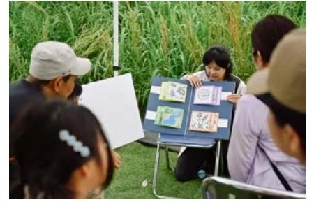
環境ワークショップ