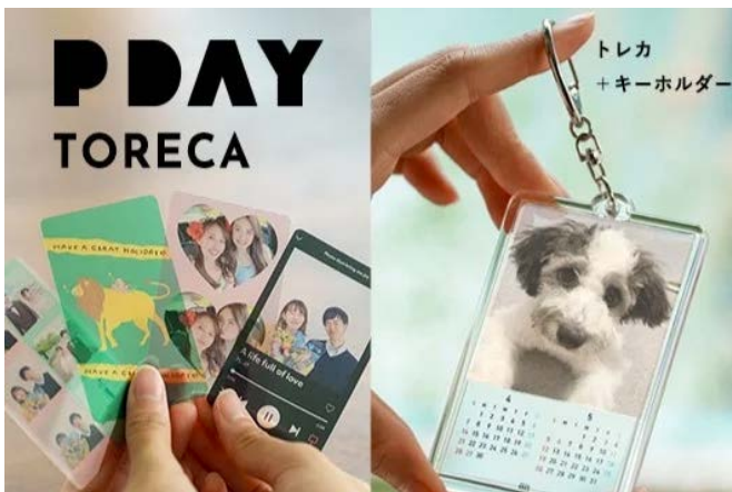
ネイチャーズデイ写真館

流域を描いた手ぬぐいやTシャツ、キーホルダーなど、多摩川を身近に感じるアイテムを販売。