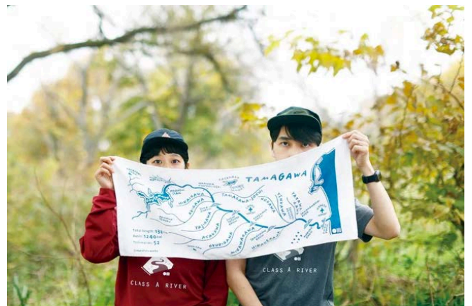
多摩川グッズストア