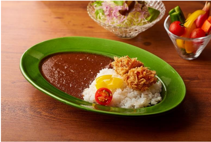
ひとくちヒレかつ×とんかつ専門店のスパイスカレー で手軽かつカレー！