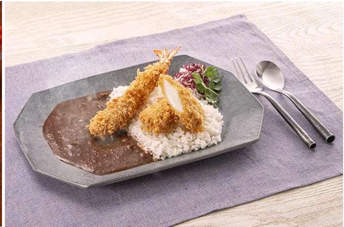
エビフライ×イカフライ×とんかつ専門店のスパイスカレー でシーフードフライカレー！