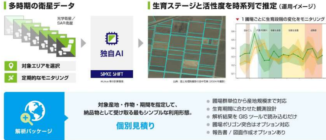
図：農作物生育モニタリング AI 解析イメージ

光学・SAR衛星データとAIを活用し、圃場単位で作物の生育ステージと活性度を推定するサービス