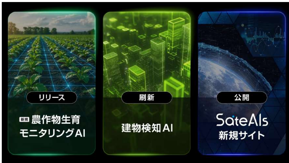
図：拡充・刷新された解析メニュー / 新規サイト公開