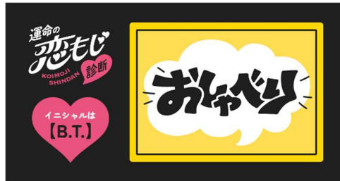
「運命の恋もじ診断」イメージ