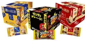
ブラックサンダー人気商品アソート ブラックサンダー1箱(20個入) ブラックサンダー至福のバター1箱(20個入) ブラックサンダーしっとりガトーショコラ1箱(20個入)