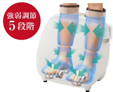
足全体を包み込んでほぐす「全周囲エアーマッサージ」

ふくらはぎ、足首、足先に6つのエアバッグを配置しています。足首と足先をエアバッグでしっかり掴み、ふくらはぎは絞りあげるようにもみほぐします。マッサージの強さは5段階の調節が可能です。