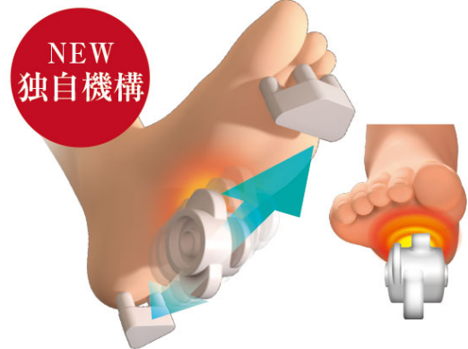
ローラーの前後移動の制御が可能になった「足裏極メカローラー」

疲れを感じやすい足裏をしっかりマッサージするため移動式ローラーを採用した「足裏極メカローラー」を新搭載しました。足の甲をエアバッグで固定し、土踏まずから指の付け根周辺にかけてはローラーが回転しながら前後に移動します。足先とかかとは指圧突起で刺激して足裏をしっかりマッサージします。足裏ローラーマッサージは3つの動作から選択が可能です。もみながらローラーが前後に動く「ムーヴ」、好みの位置でローラーを止めて集中的にもみほぐすことができる「ポイント」、そして「ムーヴ」と「ポイント」を組み合わせたマッサージを行う「自動」の3つの動作です。