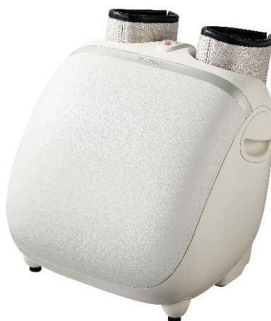
モミーナ フットマッサージャー KC-220

美と健康の総合メーカー、株式会社フジ医療器(本社:大阪府大阪市)は、足裏全体をほぐすため、ローラーの前後移動が可能になった「足裏極メカローラー」を新搭載した「モミーナ フットマッサージャー KC-220」(以下、KC-220)を2021年8月1日に発売いたします。メーカー希望小売価格はオープン価格、全国の家電量販店を通じて販売いたします。「KC-220」は、新機構の「足裏極メカローラー」と、ふくらはぎから足先まで包み込み、絞りあげるエアーマッサージを組み合わせ、より爽快なマッサージが体感いただけます。