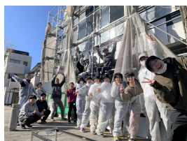
①真岡市: 「真岡まちづくりプロジェクト(まちつく)」