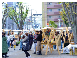
②所沢市: 「TOKOROZAWA DESIGN WALK」