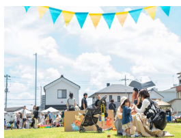
③杉戸町: 「圧倒的ホームタウン」