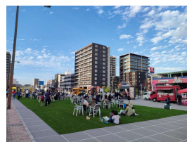
④千葉国道事務所: 「STAY STREET」