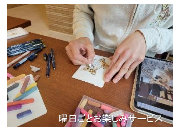
曜日ごとお楽しみサービス