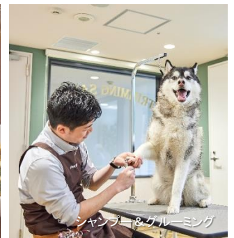
シャンプー&グルーミング