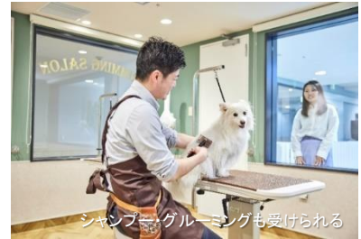
シャンプー・グルーミングも受けられる