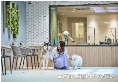
全天候型屋内ドッグラン