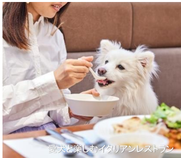
愛犬と楽しむイタリアンレストラン

東京タワーに程近い芝公園エリアに位置するinumo芝公園は、館内どこでも愛犬とリードで歩ける愛犬ファーストなホテルです。屋内ドッグランをはじめトリミングサロン、一時お預かりサービス、愛犬の料理が調理できるキッチンをはじめ、愛犬と入れるイタリアンレストランも併設。平日限定でプロカメラマンによる写真撮影やライブドローイングのイベントも開催しています。