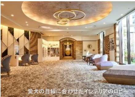
愛犬の目線に合わせたインテリアのロビー