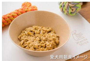
愛犬用朝食イメージ