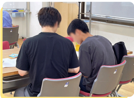
学習支援「まなびれっじ」

私が苦戦しているところを どの問題も 順を追って丁寧に 教えてくださり 解き方を理解することが できました。