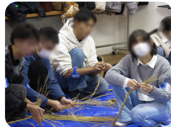
交流会「しめ縄作り」

勉強で不安なところを 解消することができました。 また勉強のモチベーションを 立て直せました。