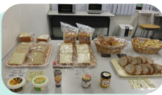
「まなびれっじ」の 昼食支援