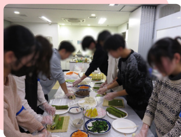
交流会「キンパ作り」