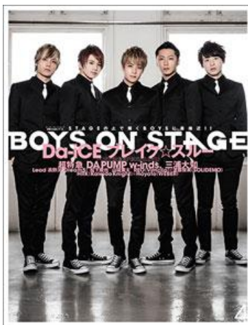
ダンス&ボーカルボーイズグループ専門誌 BOYS ON STAGE