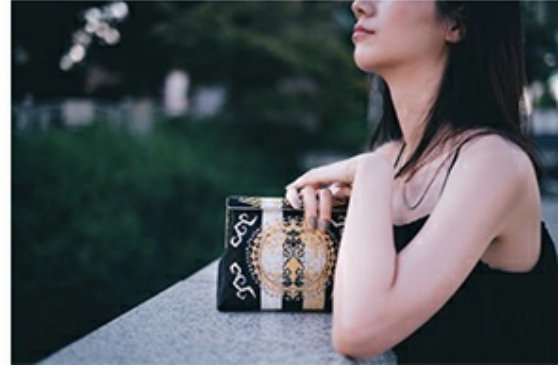
本イベントで販売する商品の利用シーンイメージ