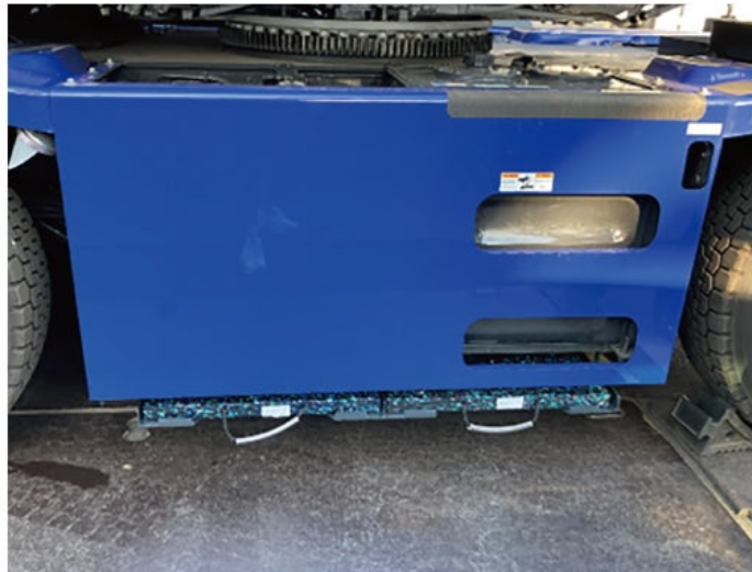
600x600x40mm (片側・1ローブ) の使用例

当社は、現場の安全を保ちながら、作業にたずさわる皆様の健康を守り、作業効率を向上させるため、この製品の日本国内での普及に努めたいと思っております。