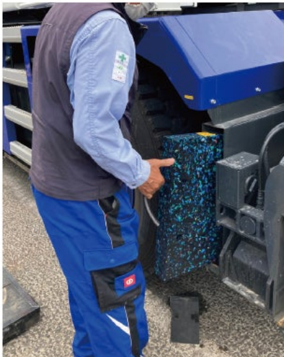
500x500x60mm (片側ローブ) 使用例

世界的に10年程前から、鉄やアルミの敷板に替わり、こちらの樹脂製パッドに切り換える動きが広がっております。欧州では建設業に従事する人々の身体への負担を軽減するため重すぎる作業用品が見直され、軽くて便利なものへと需要が移っているようです。