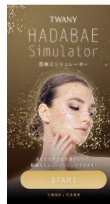
肌映えシミュレーション ができるデジタルツール 「肌映えシミュレーター」 (イメージ)

「TWANY」は、花王の化粧品事業が、国内を中心に注力するブランド群「R8」のひとつです。今後も一人ひとりの肌に寄り添い、生涯にわたる美しさを提供していくことをブランドの価値とし、親身なカウンセリングを通じて商品や美容の提案、お客さまとのコミュニケーションを行っていきます。