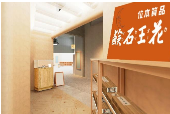
花王展示コーナー