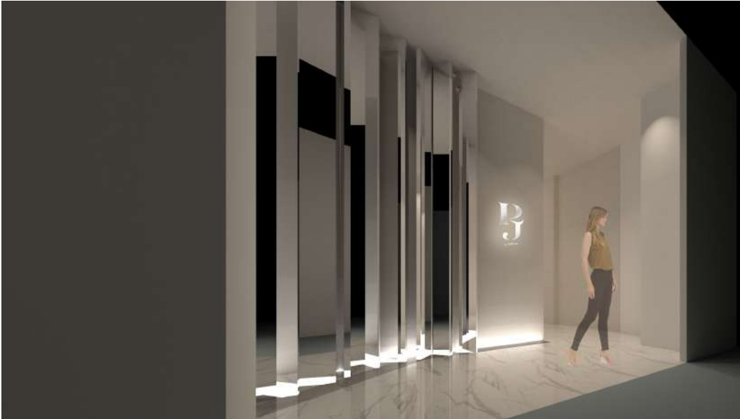
▲レディース専用サロン入口