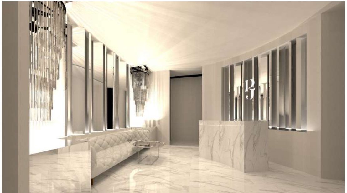
▲レディース専用サロン店内