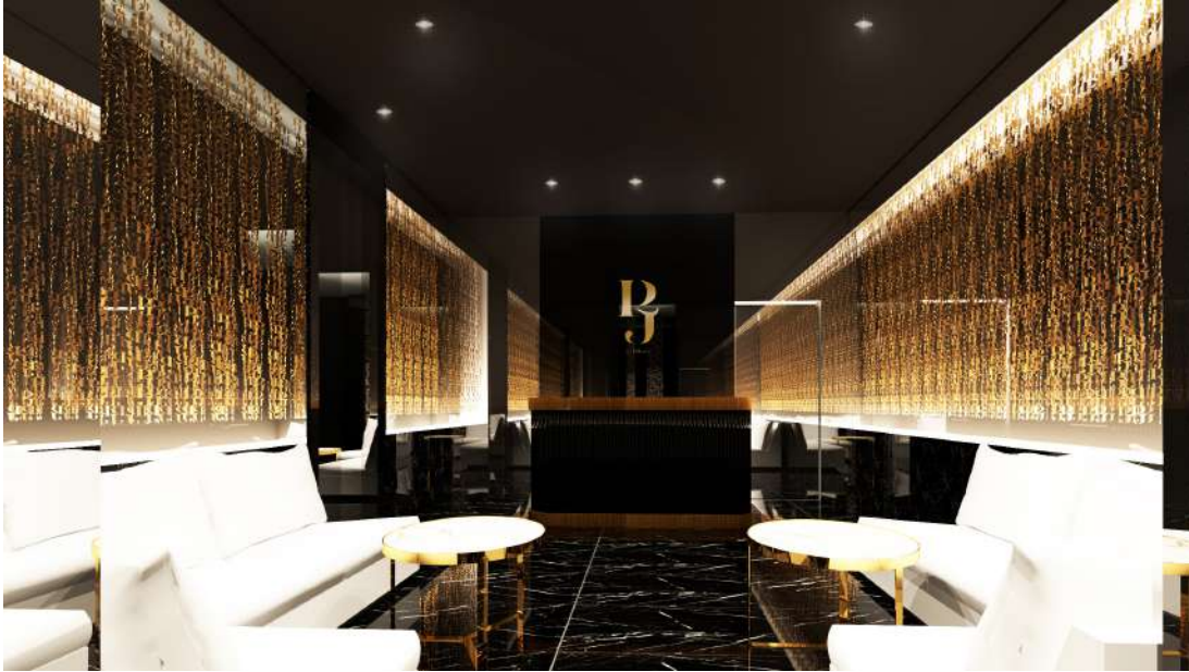
▲メンズ専用サロン店内