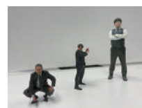
自分フィギュアの撮影体験