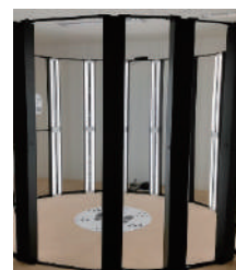
FacTrans for Full Body