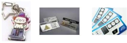
アクリル 金属 プラスチック