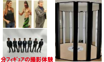
自分フィギュアの撮影体験