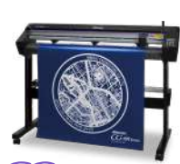
CG-130AR CUTTING PLOTTER