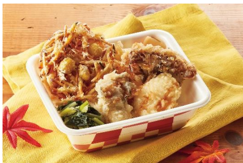
『国産秋天丼弁当』 お新香付き テイクアウト 890 円 デリバリー 1,090 円