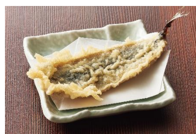
岩手県大船渡『さんま』 180 円