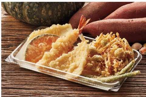
『秋味のかき揚げ+天ぷら盛合わせ』 650 円