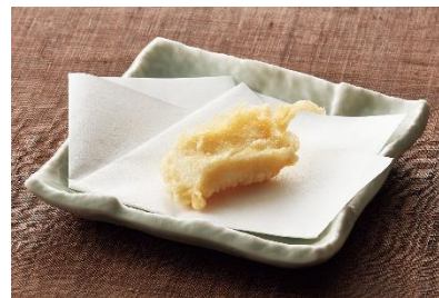
青森県産『むらさきいか』 150 円