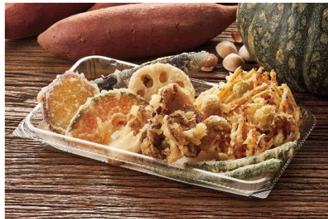
『秋味のかき揚げ+野菜天ぷら盛合わせ』 700 円

秋味のかき揚げ（かぼちゃ/さつまいも/銀杏） 海老・いか・白身魚・かぼちゃ・いんげん ※白身魚は、一部店舗で赤魚になります。