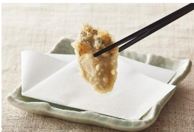
播磨灘産『牡蠣』 250 円