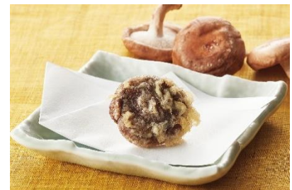
『しいたけ』 130 円