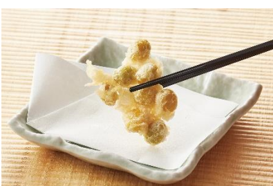
『銀杏のつまみ揚げ』 150 円