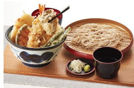
『天井プラスかき 小そばセット』 1,000 円

小そば（または小うどん）が通常価格より 60 円お得に召し上がれる国産秋天丼とのセットメニュー。