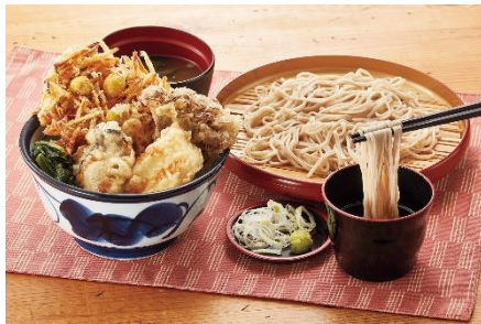
『国産秋天丼サービスセット』 1,080 円

いつもの 500 円天井に播磨灘牡蠣をのせた魚介 4 品味わえる秋のおすすめ天井！（牡蠣・海老・いか・白身魚・かぼちゃ・いんげん）