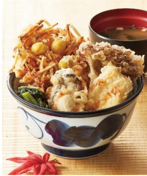
『国産秋天丼』 890 円

秋野菜の香りとてんやの秋定番播磨灘・牡蠣の味わい、青森県のむらさきいかの食感を楽しんでいただける一品。