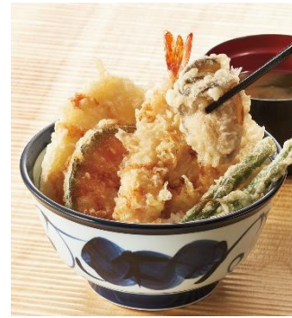
『天井プラスかき』 750 円

秋野菜の香りとてんやの秋定番播磨灘・牡蠣の味わい、青森県のむらさきいかの食感を楽しんでいただける一品。