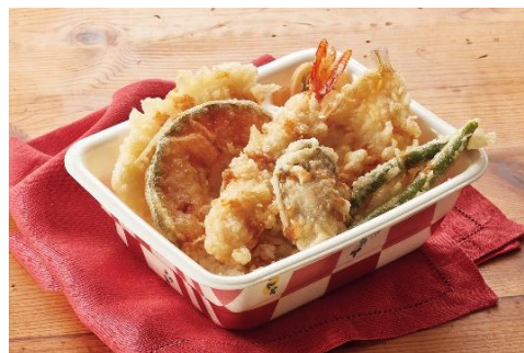
『天丼プラスかき弁当』 お新香付き テイクアウト 750 円 『牡蠣のっけ天丼弁当』 お新香付き デリバリー 950 円