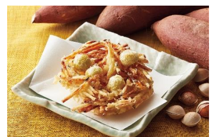
『秋味のかき揚げ』 250 円 (かぼちゃ・さつまいも・銀杏)