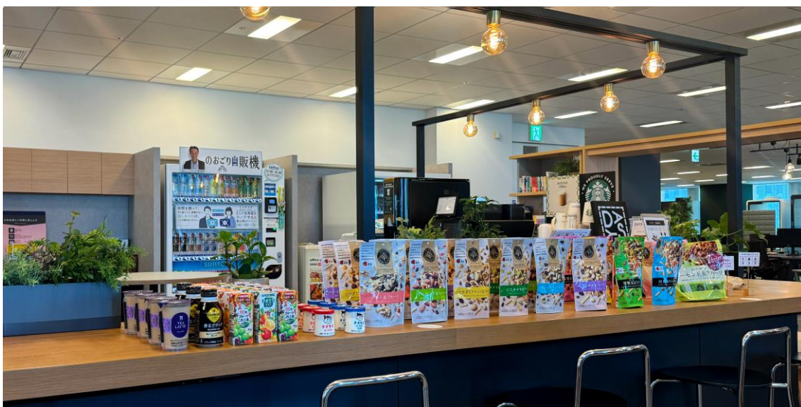
コクヨ大阪梅田オフィスの共用スペースにて実施。

株式会社MDホールディングス（本社：大阪府東大阪市）（以下「MDホールディングス」という。）は、コクヨ株式会社（本社：大阪府大阪市（以下「コクヨ」という。））が推進している「早起きチャレンジプログラム」のコンセプトに賛同し、2024年9月26日（木）に、コクヨ大阪梅田オフィスにてコラボレーション企画を実施しました。同プログラムは、仕事を朝の時間帯にシフトし、静かで集中できる環境を活かして効率的に働くことを推奨するコクヨの取り組みです。