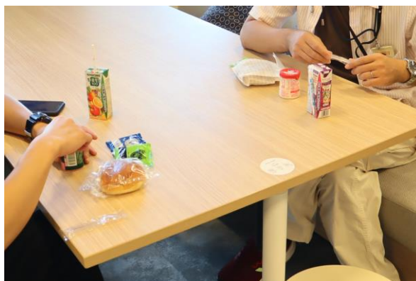
それぞれ好みのナッツスナッキングを選んでいる様子や、朝食を食べながら談笑する様子。