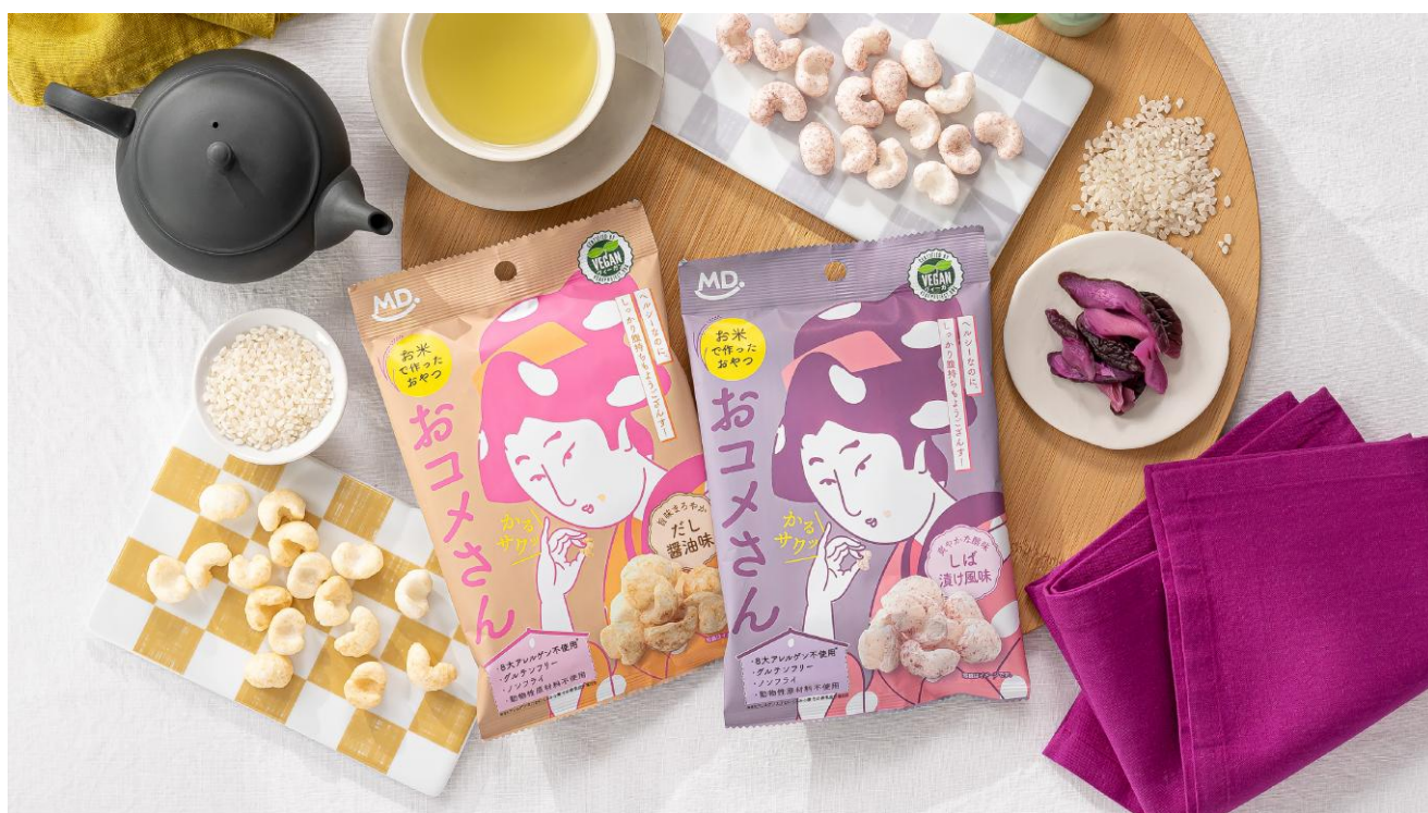
『おコメさん だし醤油味』と『おコメさん しば漬け風味』

株式会社MDホールディングス（本社：大阪府東大阪市）は、アレルギーを持つ方でも安心して食べていただける『おコメさん だし醤油味』『おコメさん しば漬け風味』を、2025年3月3日（月）より、全国で発売いたします。