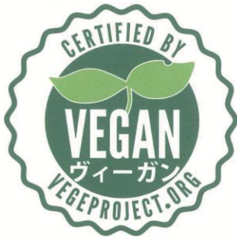
「ベジプロジェクトジャパン」ヴィーガン認証マーク