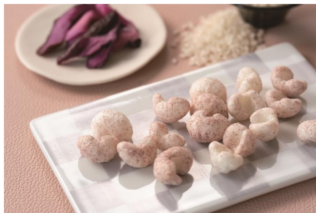
お米から作ったやさしい味わい。「だし醤油味」と「しば漬け風味」の2種のラインアップ