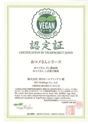
「おこめさん」シリーズのヴィーガン認定証