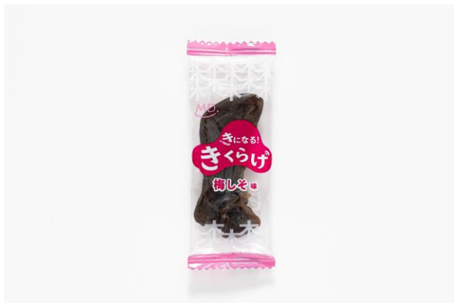
『きになるきくらげ 梅しそ味』 個包装