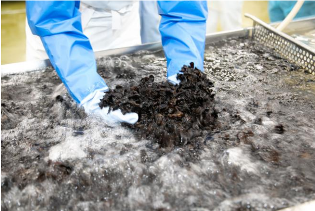
『きになるきくらげ 梅しそ味』洗浄中の様子