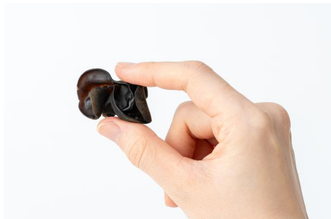
『きになるきくらげ 梅しそ味』 1個のサイズ

本商品は、南高梅の梅酢を使用して、じっくり漬け込んだ“ぷりゅこり食感”のきくらげを、ひとくちサイズに仕上げた素材菓子です。ほどよい酸味としその爽やかな風味がバランスよく組み合わせることで、飽きずに楽しめる味わいを実現しました。不足しがちな栄養素の鉄を含み、低脂質かつ、食物繊維・ビタミンDも豊富です。さらに、個包装タイプなので持ち運びにも最適です。外出先やオフィスで小腹が空いた時、また、口さみしい時のヘルシーな間食にぴったりです。罪悪感なく楽しめる新感覚お菓子として、ストレスフリーな間食習慣をサポートいたします。