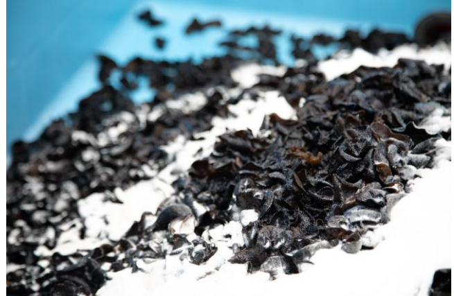
『きになるきくらげ 梅しそ味』調味中の様子