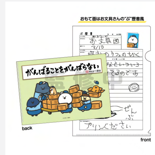
<ぶ歴史クリアファイル>