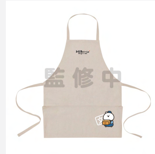
キッチンエプロン