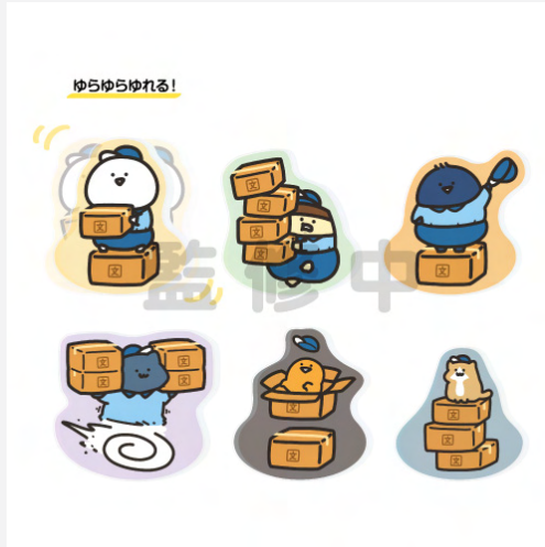
<トレーディングアクリルマスコット>