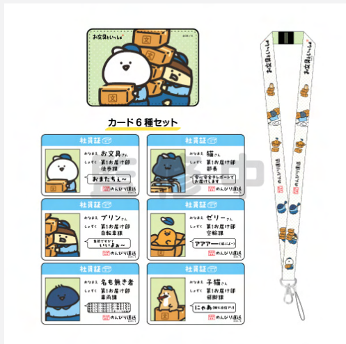
<ネックストラップ & 社員証風カード>