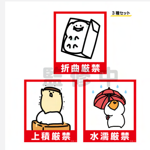
<荷札ステッカー (3種セット)>

※掲載している商品は一部です。※画像はイメージです。※商品の仕様は予告なく変更になる場合がございます。