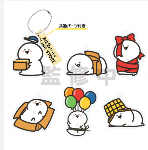
<トレーディングアクリルキーホルダー (おぶだらけ)>