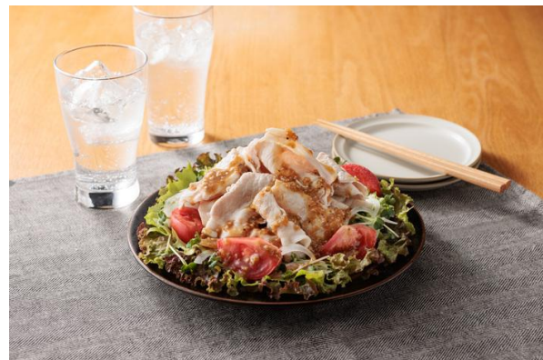
【にんにく豚しゃぶサラダ】