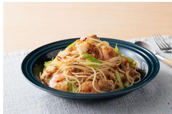
【海鮮ペペロンチーノ】

エスエスケイフーズお客様相談窓口 0120-683741(土・日・祝日を除く 9:00~17:00)