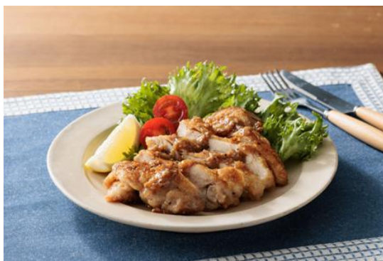
【ガーリックチキンソテーサラダ仕立て】