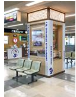
到着ロビー柱装飾