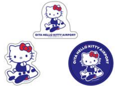
ステッカー（全3種） 各396円