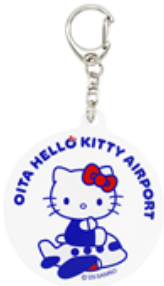
アクリルキーホルダー 660円

販売場所：大分空港 国内線ターミナル2階 空の駅「旅人」（たびと）、ハーモニーランド内ショップ「カントリーマーケット」