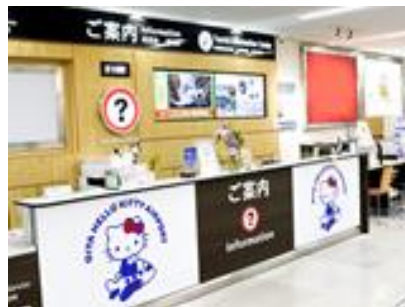
国内線1階インフォメーション