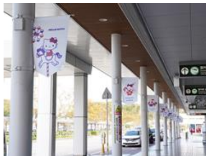
国内線ビル玄関フラッグ