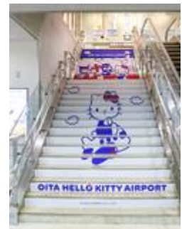
国内線ビル中央階段