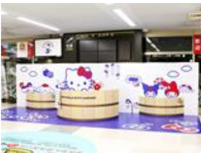
到着ロビーフォトスポット