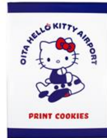
プリントクッキー 756円