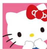
陽谷駅舎/天窓デザイン