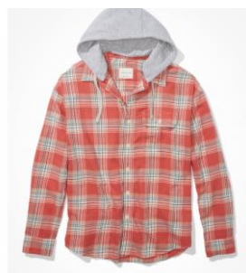
AE スーパーソフト フ ランネル フーディ ¥9,211