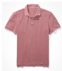
AE スーパーソフト ヴィ ンテージ アイコン ポロ シャツ ¥3,724