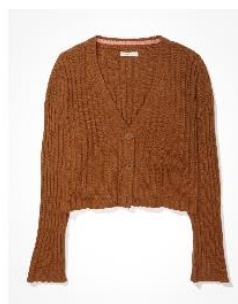
AE クロップド ボクシー ボタンアップ カーディ ガン ¥6,859