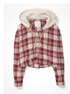
AE チェック フード付 き クロップド フラン ネルシャツ ¥6,859