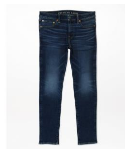
AE AirFlex+ パッチ スキニー クロップド ジーンズ ¥13,914