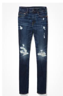
AE AirFlex 360 パッチ スリム ジーンズ ¥17,049