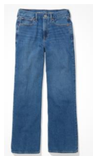
AE スケートー ジーンズ ¥15,481