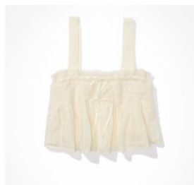
AE レース スイング キャミソールソール ¥5,292