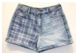
AE ハイエスト ウエス ト デニム マム ショ ートパンツ ¥9,211