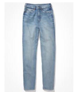
AE バギー マム ジ ーンズ ¥12,346