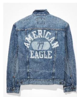
AE ロゴデニムジャケ ット ¥13,914