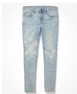
AE AirFlex 360 パッチ スキニ ー ジーンズ ¥17,049