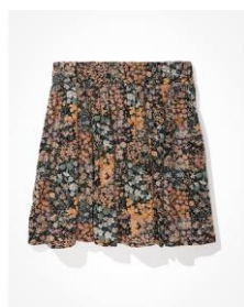
AE プリーツ ミニスカ ート ¥6,076