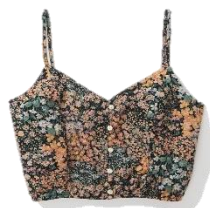
AE プリント クロップド キャミソールソール ¥4,508