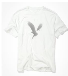
AE スーパーソフト ヴィンテージ ポール ト グラフィック Tシ ャツ ¥3,724