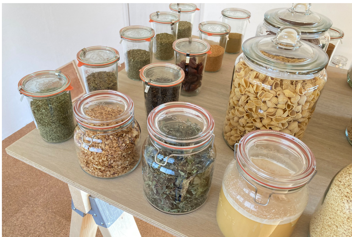
個包装せず、瓶に入れて販売

「fu tai」は、消費者が袋や瓶などの容器を持参することで、パッケージフリーで必要な量だけグラム単位で購入が出来る量り売り店です。