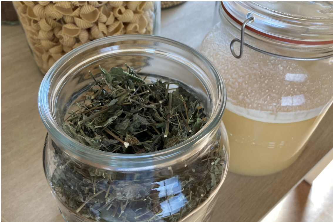
大阪産レモンバーム

店舗のある大阪市福島区鷺洲は、都市部であり利便性の良い梅田駅のほど近くにありながら住宅が立ち並ぶエリア。徒歩1分の距離には大きな木が植えられた市立公園もあります。