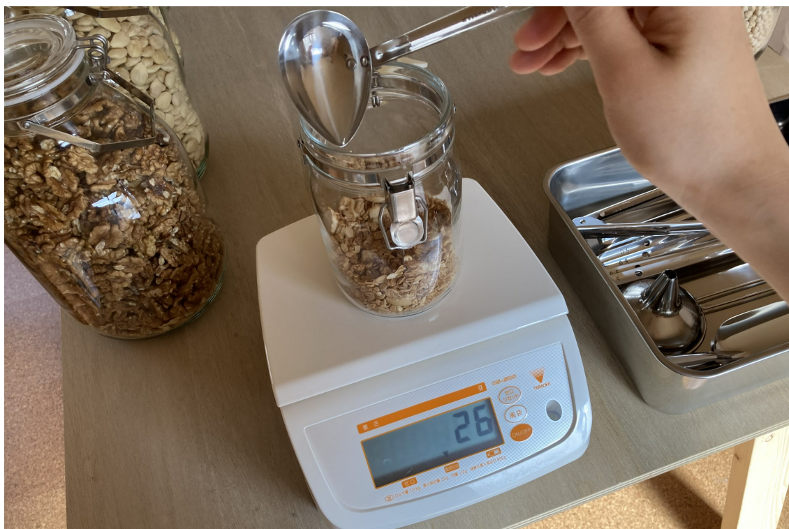
グラム単位で購入できる