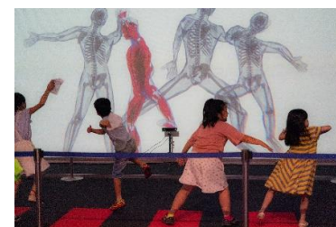
にんげんスケスケ(イメージ)