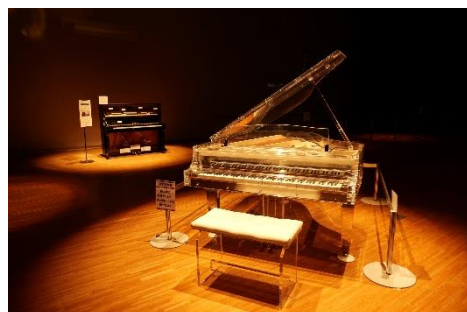
スケスケナイト (イメージ)