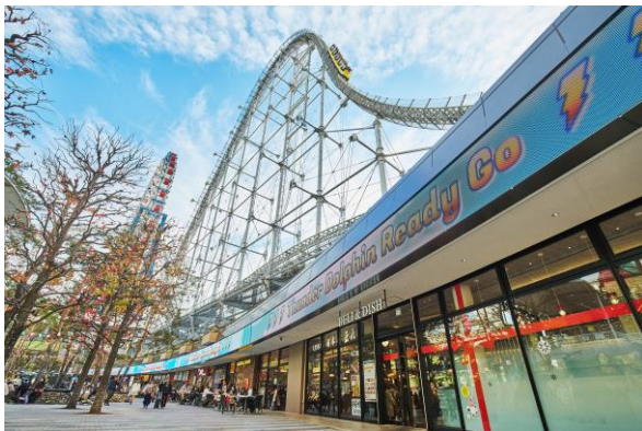
サンダードルフィン走行時(昼)

※「Out Of Home」の略。交通広告や屋外広告などの家庭以外の場所で生活者に接触する広告メディア