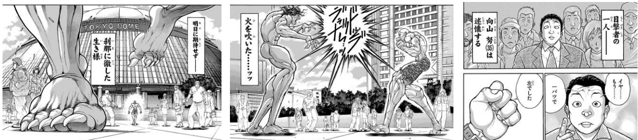
「範馬刃牙」より「ジャック・ハンマーvsピクル」 ©板垣恵介(秋田書店)1992