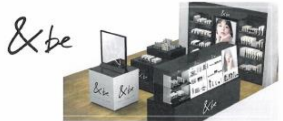
<「&be」スペシャルタイアップエリア イメージ>