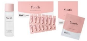
千葉由佳さん プレゼント イメージ