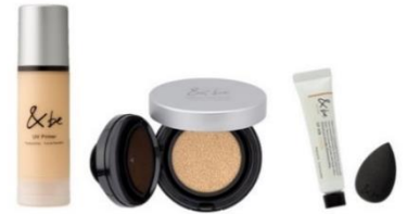
&be ベースメイクセット 6,270 円 (クッションファンデーション 12g、UVプラ イマー 36g、UVミルクスタンダードミニ 10g、ブラックスポンジミニ)