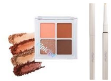
ふくれなさん プレゼント イメージ