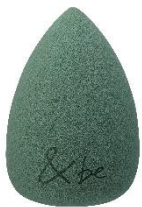
&be ブラックスポンジ ショップイン限定 カーキ 770円

パウダーもリキッドも、どんな製品にも使える、&beのアイコン的なアイテム「ブラックスポンジ」の限定カラー。