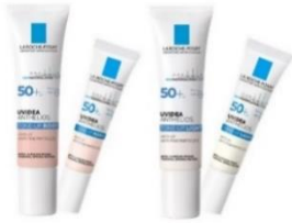
ラ ロッシュ ポゼ UV アイデア XL プロテクション トーンアップセット 3,740 円