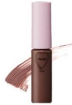
WHOMEE マルチマスカラ ディープピンク 1,650 円

絶妙なピンクブラウンが話題の WHOMEE 公式 WEB 限定カラーが ショップイン店頭に登場。