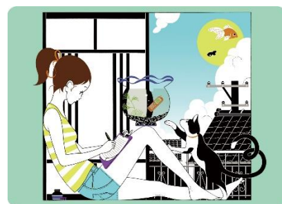
来場者特典 オリジナルトレーディングカード(イメージ)

「ブルーライン」©Ki/oon Music、「電話」、「レター」©Yusuke Nakamura ※画像左から