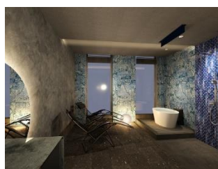
ととのいスペース(イメージ)