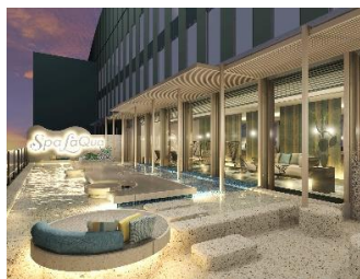
フットプール(イメージ)

フットプール(水温約 20～30℃)やバー、休憩ラウンジが一体となったエリアが新登場します。東京ドームシティを眺めながらゆったりと休憩いただける、都心にいながらリゾート感あふれる体験ができます。