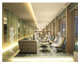
休憩ラウンジ(イメージ)

※東京ドーム天然温泉 スパ ラクーア URL: https://www.laqua.jp/spa/