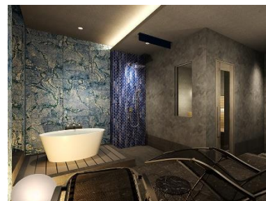
「Rentola」スタンダードルーム(イメージ)