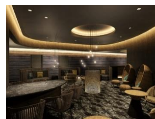
専用ラウンジ(イメージ)