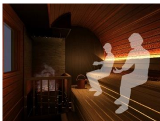
サウナ室(イメージ)

男性用、女性用のパウダールームを用意しています。専用ラウンジでは、休憩や談笑、デスクワークなど、サウナ後の自由なひとときをお過ごしいただくことができ、併設のカフェではコーヒーやドリンク、軽食等をお楽しみいただけます。個室利用時間の終了後2時間までご利用いただけます。