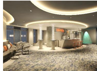
休憩スペース(イメージ)