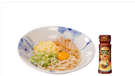
① 釜玉うどん with 日清やみつきオイル ごま油にんにく