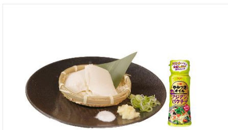
② 自家製ざる豆腐 with 日清やみつきオイル アジアンパクチャー