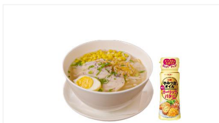
③ コーン入り蒸し鶏のフォー・ガー with 日清やみつきオイル ガーリックバター風味