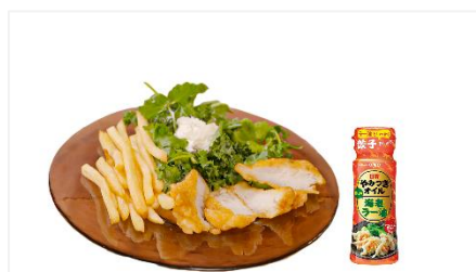
④ フィッシュ&チップスパクチャー添え with 日清やみつきオイル 海老ラー油を サワークリームにかけて