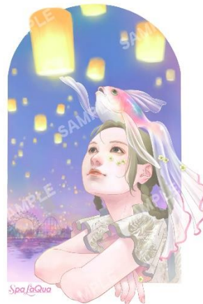
「Wish upon a floating」 © natsukoehizen 2024