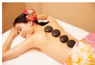
エステ&リラクゼーション (イメージ)