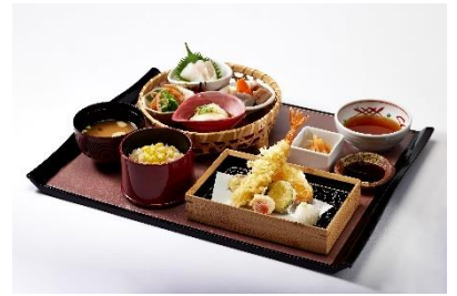
「秋の大人様ランチ」、「フエの幸せ混ぜご飯「コム アン フー」、「旬彩ご膳」 ※画像左から (イメージ)