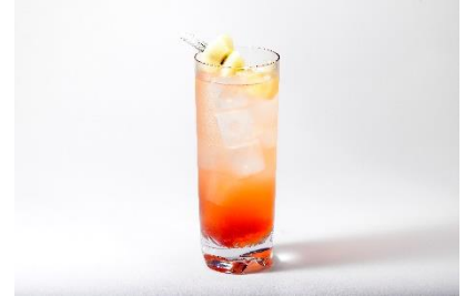
「フルーツポンチ」、「チルアワー」、「桃とアールグレイのジントニック」 ※画像左から (イメージ)