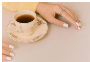
N Cream Cotton

上品なソフトベージュのフルカラーネイルは、季節やシーンを問わず使える万能選手。流行の少しくすんだ色みが、落ち着いた雰囲気をもたらす、清潔感のある指先を印象づけます。他のカラーやアートネイルとも組み合わせやすく、自分らしいアレンジが楽しめます。