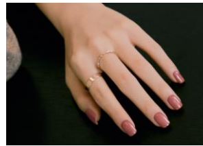
N Cream Rose

澄んだ秋の空気のような、少し透明感のあるクリーミーなカラーに注目。淡いクリームイエローのフルカラーネイルは、ブラウンやカーキなどのナチュラル系のカラーにも、赤や黒、ネイビーなどメリハリのあるカラーまで合わせやすく、おしゃれの幅が格段に広がります。