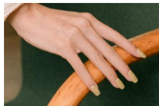
N Cream Butter

指先も心も暖かに包み込むマスタード色のフルカラーネイル ムラのない美しい仕上がりを手軽に手に入れることができるohoraのフルカラーネイル。充実のカラーバリエーションで、さまざまな色にトライできるのも魅力です。秋冬の気分を盛り上げるのは、少し透明感のあるマスタードイエロー。暖かなニュアンスをつくり、ニットのおしゃれにもマッチします。