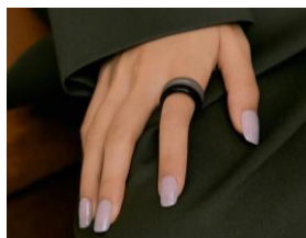
N Cream Lavender

透け感のあるやわらかなグリーンは、見ているだけで心穏やかに。ゆっくりと過ごしたい休日にもぴったりのフルカラーネイルです。ベージュや生成り、ブラウンなど、ナチュラルトーンの服とも好相性。フルカラーネイルならではの、シックな秋スタイルをつくり上げます。