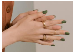
N Cream Moss

指先を明るく見せるメープルオレンジのフルカラーネイル ムラなく均等に塗るのが難しいフルカラーネイルはohoraにおまかせ。絶妙な半透明の仕上がりが、清潔感や上品さを感じさせます。深みのあるメープルオレンジは、秋冬シーズンにふさわしい暖かみのあるカラー。肌とのなじみがよく、指先を明るく見せる効果もあります。