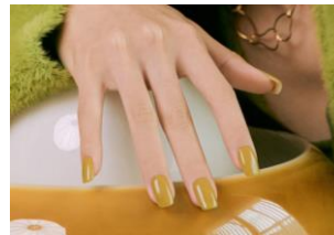
N Cream Pumpkin

奥行きのある色みと、ほどよい透明感が魅力的なフルカラーネイルのシリーズ。落ち着いた雰囲気インディゴブルーは、オフィスから休日スタイルまで、幅広い着こなしにマッチします。シーズンを問わず使えるので、定番カラーとして押さえておくべし。