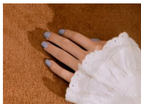
N Cream Cloud