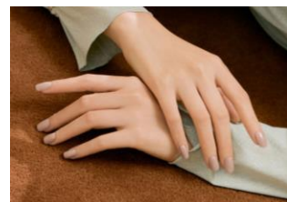
N Cream Beige

赤みのあるブラウンのマルササカラーに少し透明感を与え、クリーミーに仕上げたフルカラーネイル。ほんのり甘く、まろやかな雰囲気をつくり、周囲の空気まで和ませます。肌なじみのよいカラーなので、デ일리リー使いにもぴったり。秋のファッションやメイクとも相性抜群です。