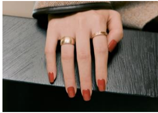
N Cream Maple

2021年秋冬コレクション“Mix & Match collection”は、2021年9月15日（水）に12色が新登場。