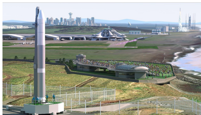
北海道スペースポート 将来イメージ図

HOSPOは世界の宇宙ビジネスを支えるインフラとして、航空宇宙の研究開発、ビジネスサポート、地方創生事業を含むビジネス機会を提供します。2025年までに2つの人工衛星用のロケット発射場整備を進めており、資金確保にはふるさと納税（企業版・個人版）および寄附の仕組みを活用しています。