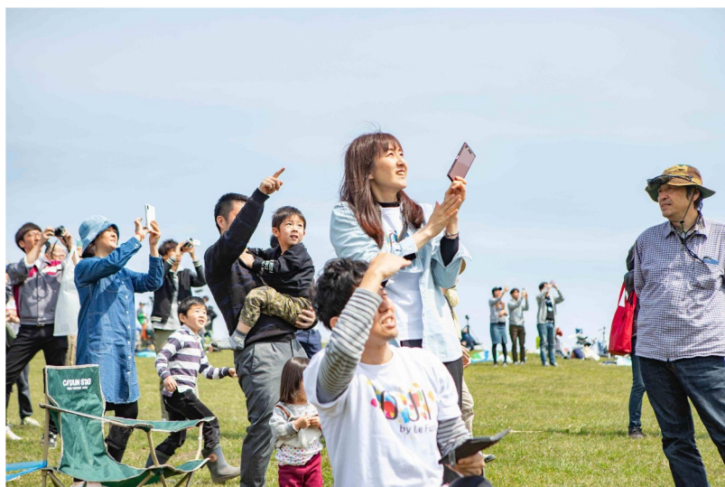
民間ロケット打ち上げ見学イベントの様子

また、航空宇宙のコンテンツと、北海道十勝の大樹町がもともと持ちあわせている食や農業、大自然などの地域資源を組み合わせ、地域ならではのユニークな観光価値を創出し、町内外の多様な事業者との連携を図り、北海道、十勝、大樹町の観光振興に貢献したいと考えています。