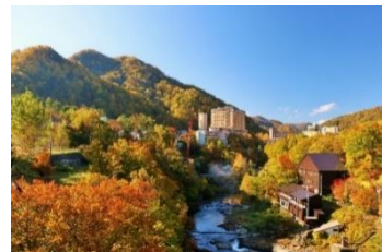
北海道 定山溪温泉

<北海道エリア> 1位は、昨年2位の定山溪温泉がランクアップ。札幌中心部からほど近く、北海道・札幌の奥座敷と称される自然豊かな温泉地。美しい紅葉や、体の芯まで温まる良質な塩化物泉が魅力です。また、豊平川の溪流沿いに広がる温泉街には、無料の足湯や手湯が点在し、温泉を手軽に楽しむことができます。