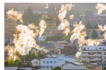
大分県 別府温泉郷

<九州エリア> 1位は別府八湯 別府温泉郷が昨年5位からランクアップ。日本一の湧出量を誇る温泉郷で、市内全域に8つの温泉地が点在しています。それぞれに特徴が異なり、砂湯やむし湯など様々な入浴形態で独特のリラックス体験が味わえます。観光やグルメも充実し、幅広い世代に人気の温泉地です。