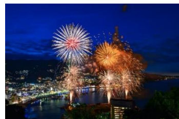
静岡県 熱海温泉 熱海海上花火大会

<関東エリア> 熱海温泉が1位をキープ。主な泉質は塩化物泉で、全国でも有数の湯量を誇る温泉地です。新オープンや話題のスポットも目白押しで、常に多くの観光客でにぎわいます。年間を通して10回以上も開催されている「熱海海上花火大会」は熱海の代名詞となりつつあり、今年は史上初のゴールデンウィーク開催が話題になりました。