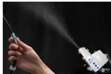
※ミスト量は微調整可能

超微細なミストは体に到達する直前で気化します。ミストが気化すると、気化熱を奪うことで、その周りの気温を下げる効果があります。運転席周辺の気温を下げることで熱中症対策と快適性をお届け。