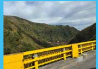
雁坂大橋から眺められる景色