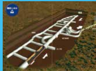
雁坂トンネル内部構造