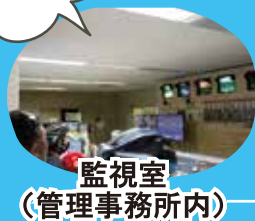
監視室 (管理事務所内)

24時間体制で トンネルとドライバーの 安全を守っている 監視室を特別に 見学できます!