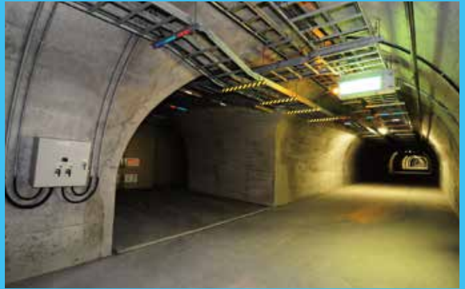
普段入ることが出来ない雁坂トンネルの避難坑