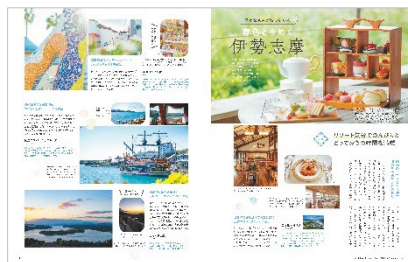
<春色ときめく伊勢志摩>