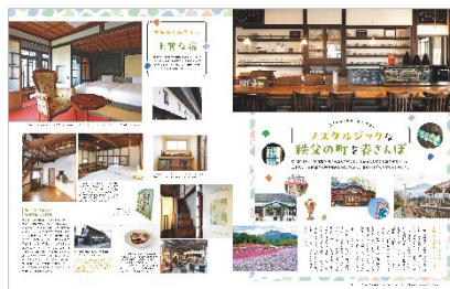
<ノスタルジックな秩父の町を春さんぽ>