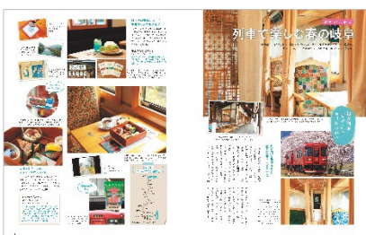
<列車で楽しむ春の岐阜>