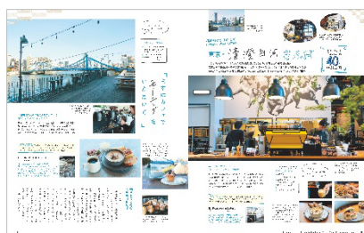
<東京・清澄白河さんぽ>