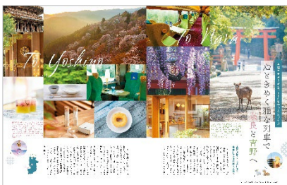
<心ときめく雅な列車で奈良と吉野へ>