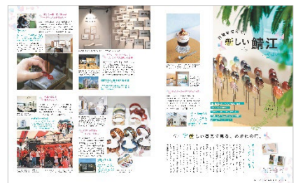
<目線を変えて、新しい福井・鯖江>