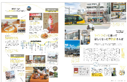
<新しくなった宇都宮さんぽ>